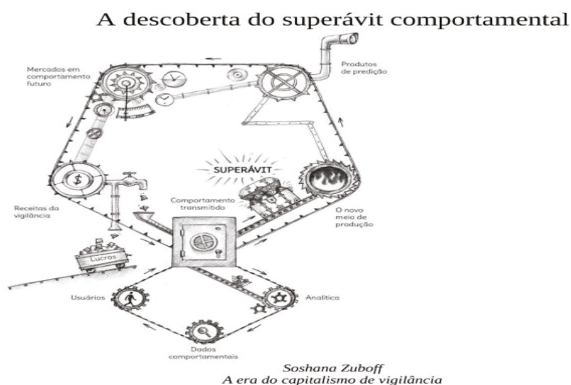
Esquema 01: A máquina do capitalismo de vigilância

Fonte da imagem: A era do capitalismo de vigilância: a luta por um futuro humano na nova fronteira do poder